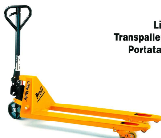
Little Mule® Transpallet HU Profi Portata Kg 2.500