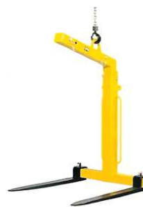
Forche per gru